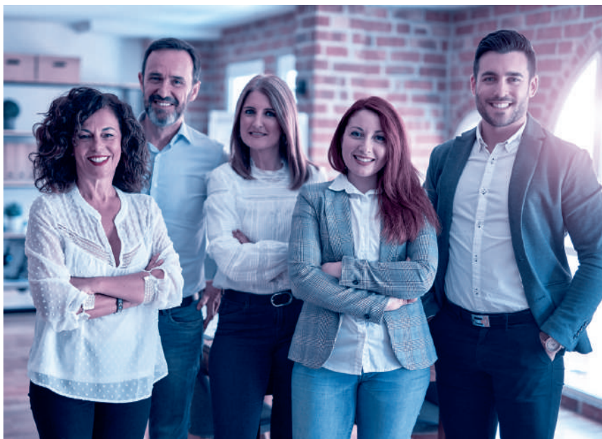
Alles klar: Das Personalreglement schafft eine verbindliche Regelung der Arbeitsbeziehung.

Grundlegender Bestandteil des Personalreglements ist das Arbeitszeitmodell des Unternehmens. Also beispielsweise die gleitende Arbeitszeit mit definierten Blockzeiten, Regelungen zum Homeoffice und die im Betrieb übliche Wochenar-